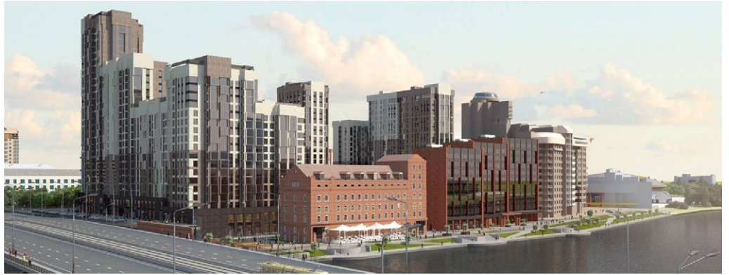
Объект ЖК «Макаровский квартал», г. Екатеринбург (Россия).