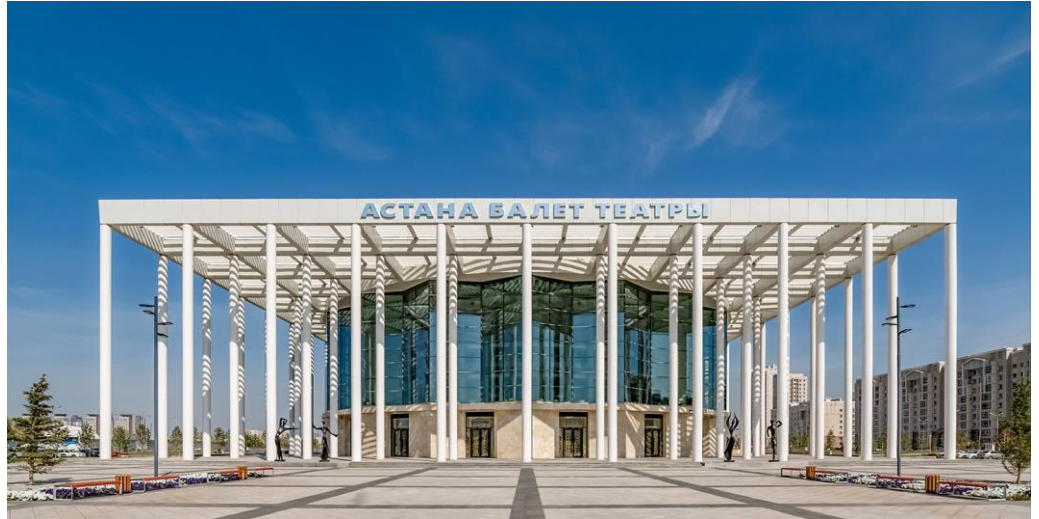
Город Нур-Султан, Казахстан Театр балета Астаны