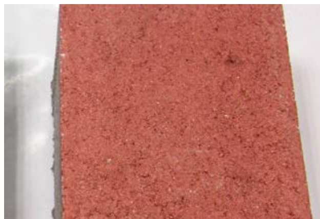
Powierzchnia impregnowana MasterPel SP 5000