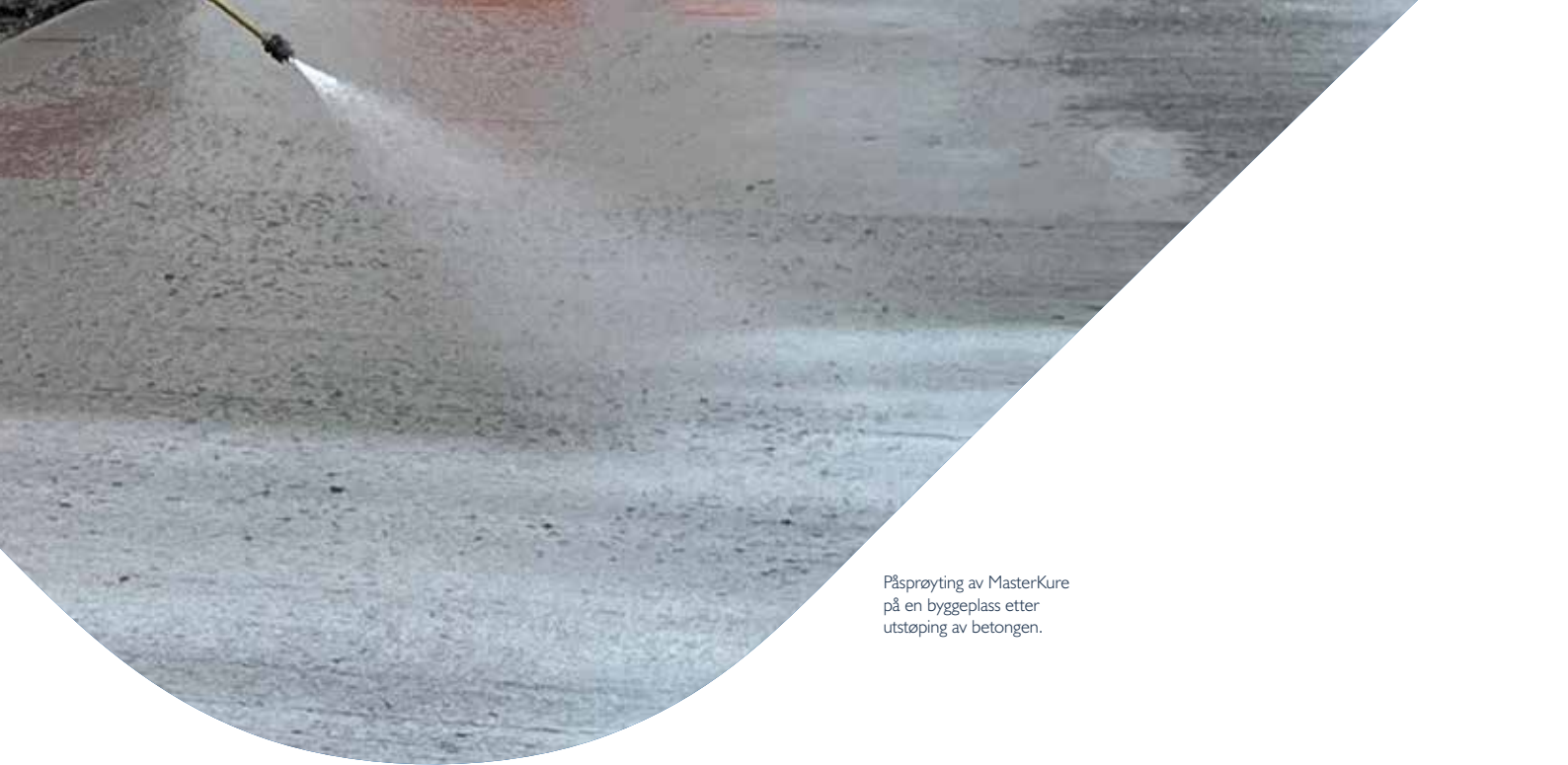
Påsprøyting av MasterKure på en byggeplass etter utstøping av betongen.