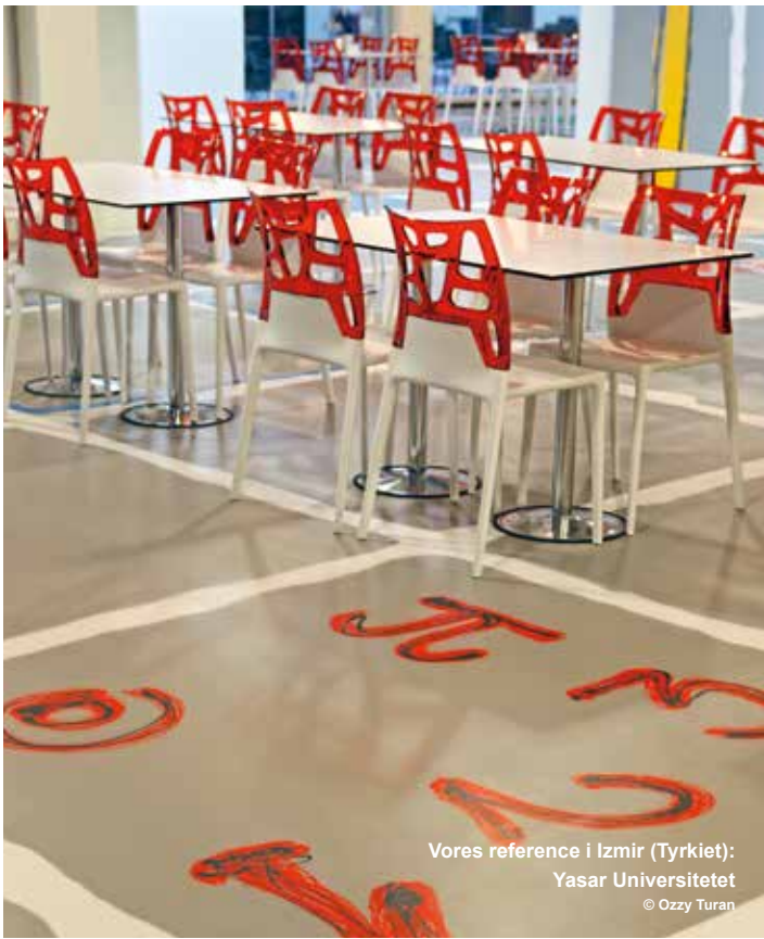
Vores reference i Izmir (Tyrkiet): Yasar Universitetet