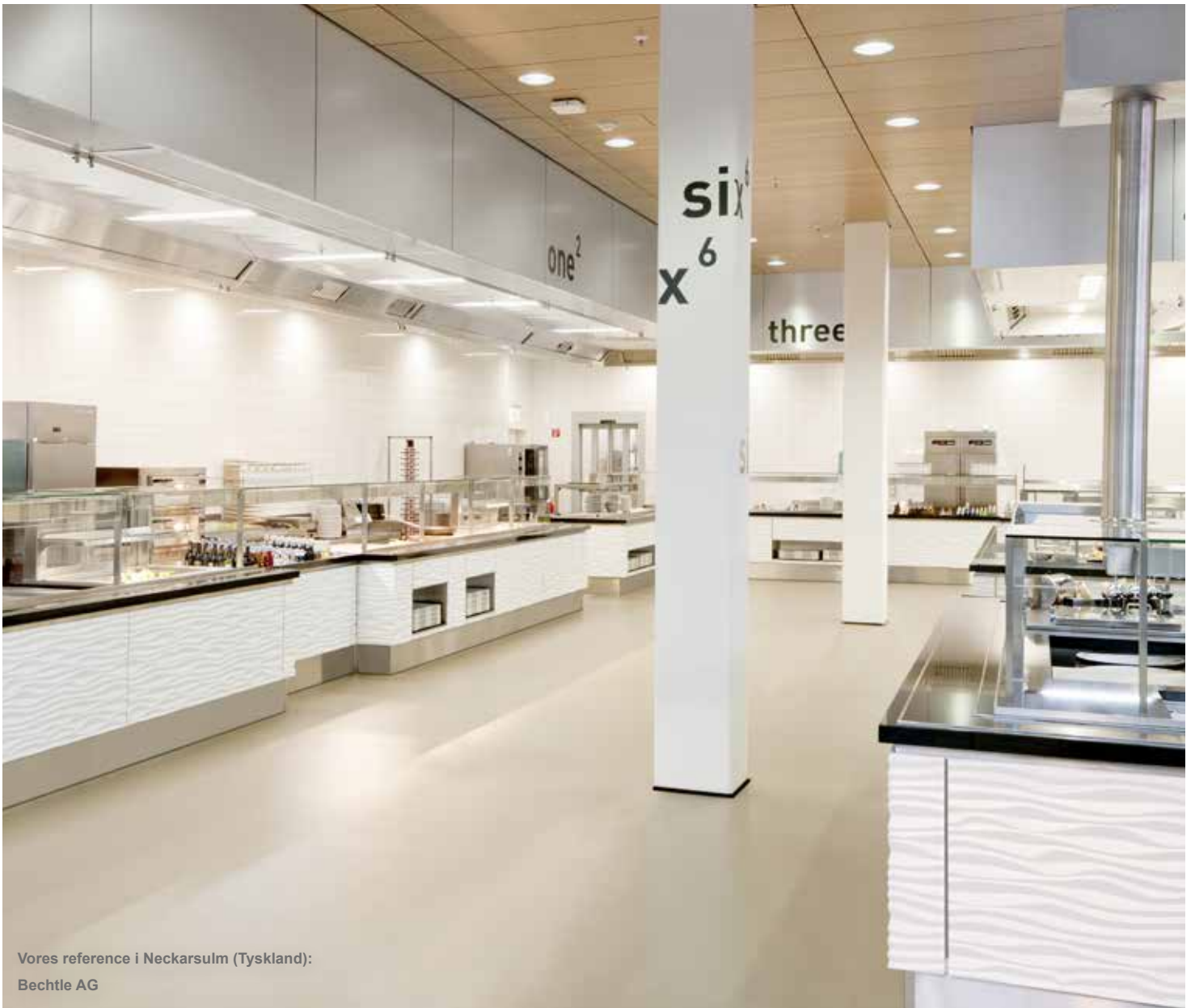
Vores reference i Neckarsulm (Tyskland): Bechtle AG