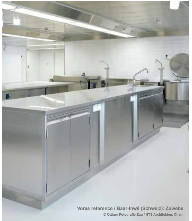
Vores reference i Baar-Inwil (Schweiz): Zuwebe HTS Architekten, Cham