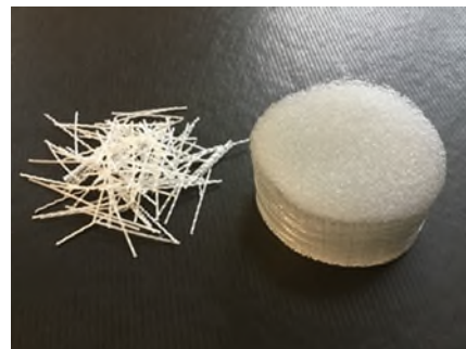
Macro fibre in polipropilene MasterFiber 246 SPA

Ottima disperdibilità: assicurano una ottima disperdibilità e uniformità prestazionale