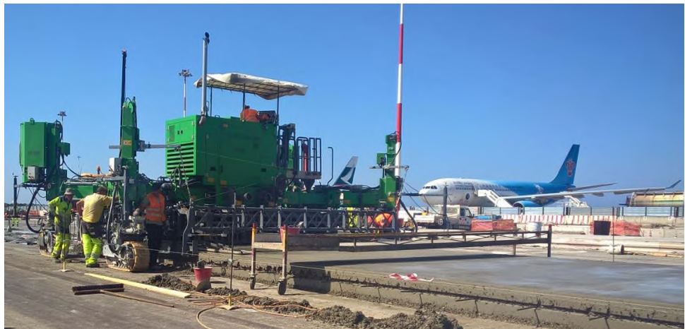
La nostra referenza presso l'aeroporto Fiumicino di Roma (Italia)