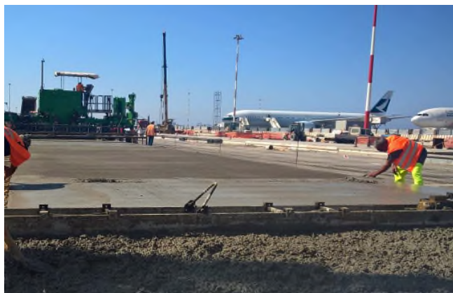
La nostra referenza presso l'aeroporto Fiumicino di Roma (Italia)