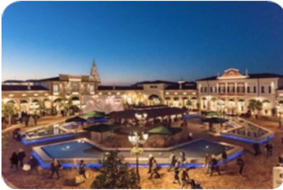
La nostra referenza a Noventa di Piave, Venezia (Italia)

Del McArthurGlen Designer Outlet, c/o Noventa di Piave (VE)