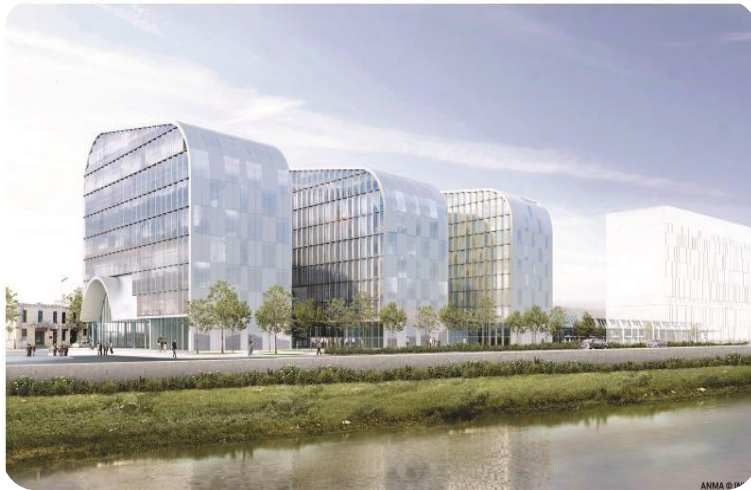
Halle Débat Ponsan - Bordeaux