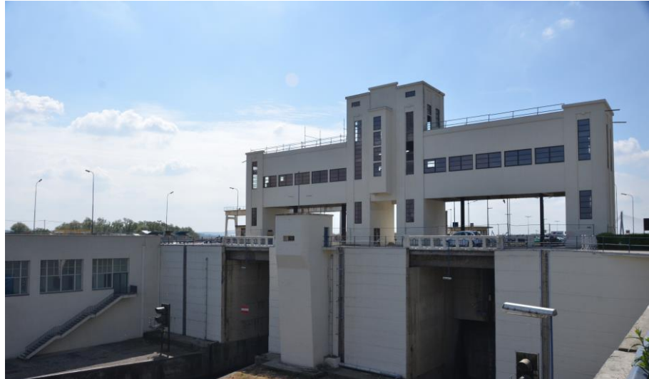
Notre référence à Lannaye (Belgique): les écluses de Lannaye