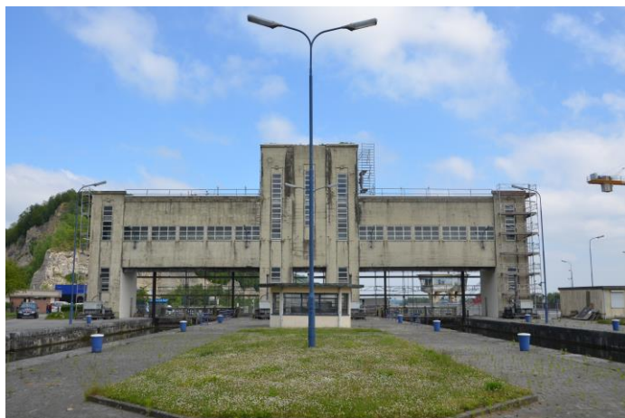
Notre référence à Lannaye (Belgique): Les écluses de Lannaye