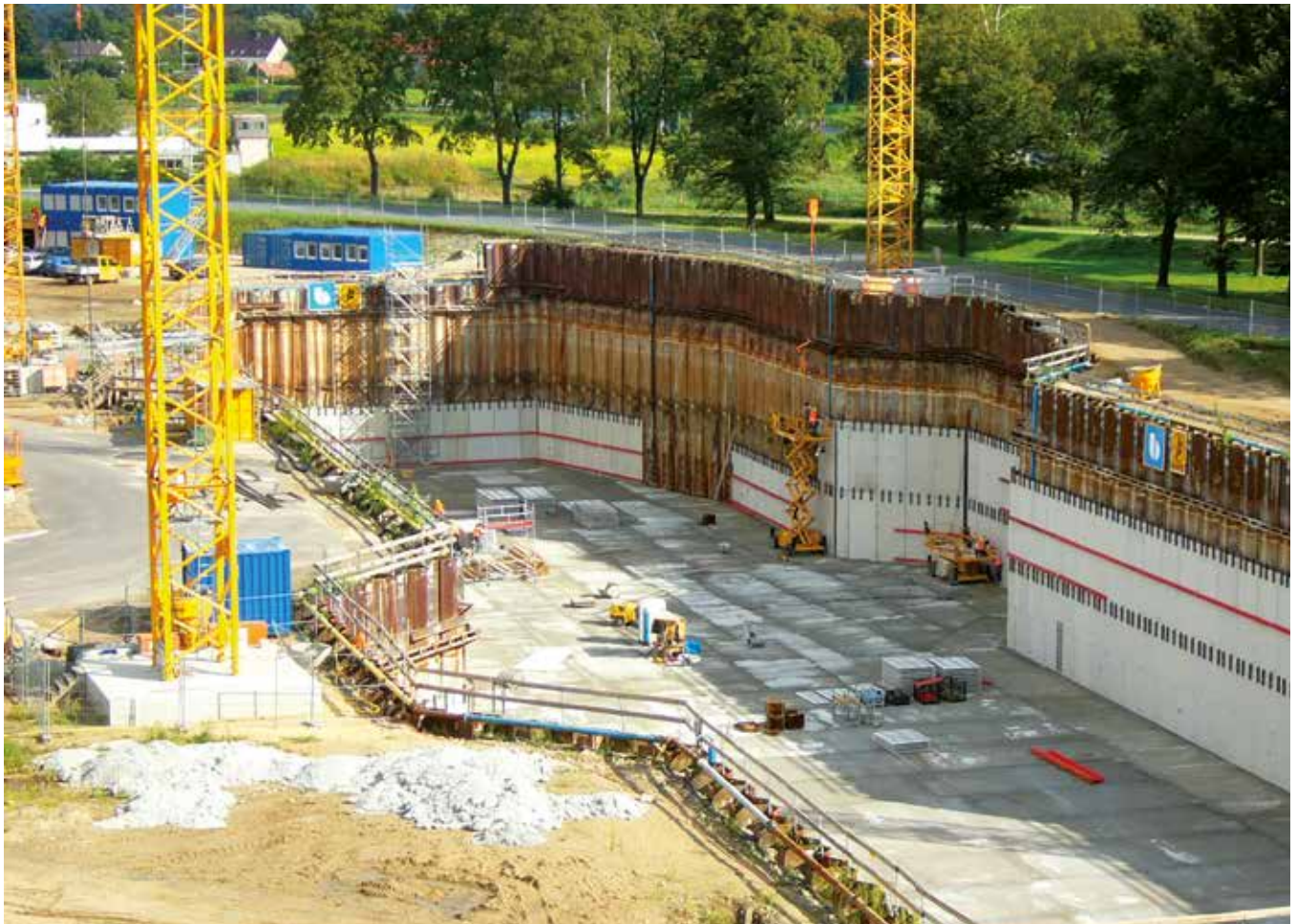
Referenssikohteemme Niederfinowissa Saksassa: veneen noston alusta.