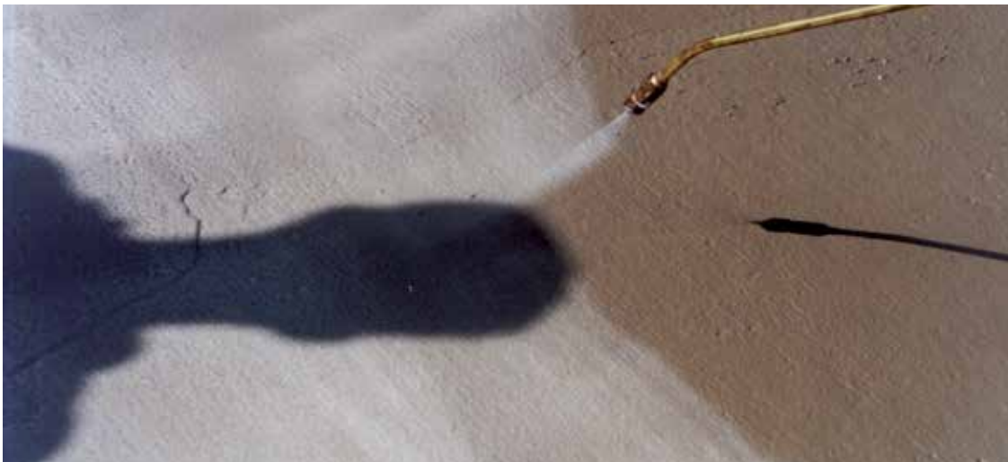
MasterKuren levitys betonin pinnalle rakennustyömaalla.

Tähän Master Builders Solutions -asiantuntijoilla on tarjottavana kattava valikoima jälkihoitoaineita. Suosittelemme varhaisjälkihoitoainetta, jotta voidaan varmistaa täydellinen hydrataatio ensimmäisten tuntien aikana ja helpottaa hierontaa. Liuotteettomat, vesipohjaiseen vahaan perustuvat jälkihoitoaineet ovat erittäin tehokkaita, ympäristöystävällisiä ja taloudellisia käytössä. Valkoiseksi pigmentoitu jälkihoitoaine lisäksi vähentää lämpötilan nousua betonissa, joka altistuu auringonpaisteelle. Polymeerihartsipohjainen tuote liuotettuna orgaaniseen liuottimeen tarjoaa ideaalin ratkaisun, kun halutaan tehokkuutta yhdistettynä aikaiseen levitykseen ja nopeaan kalvonmuodostukseen.