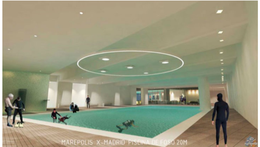
Centro Marepolis Madrid