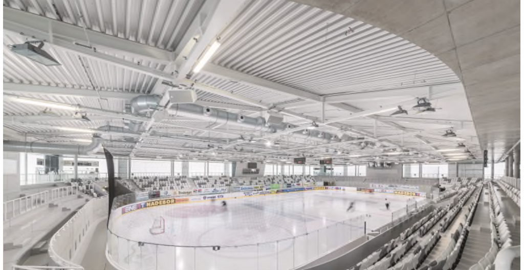
Unsere Referenz in Weißwasser (Deutschland): Eisarena