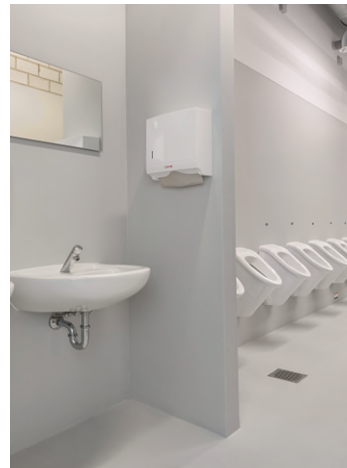
Unsere Referenz in Weißwasser (Deutschland): Eisarena