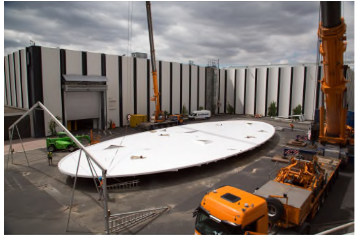
Unsere Referenz in Frankfurt (Deutschland): Messe Frankfurt Tor Nord