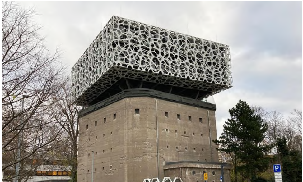
Unsere Referenz in Ludwigshafen: BASF SE