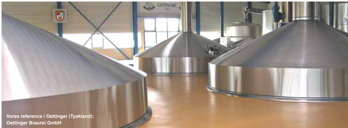
Vores reference i Oettinger (Tyskland): Oettinger Brauerei GmbH