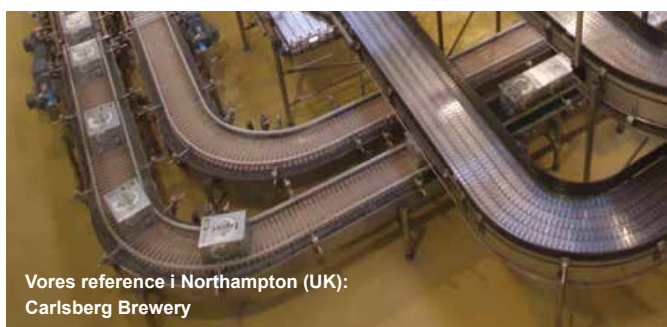
Vores reference i Northampton (UK): Carlsberg Brewery

Kravene til det enkelte gulv varierer fra sted til sted. Du er velkommen til at kontakte gulvspecialisterne fra Master Builders Solutions for at finde den rigtige løsning til dit behov.