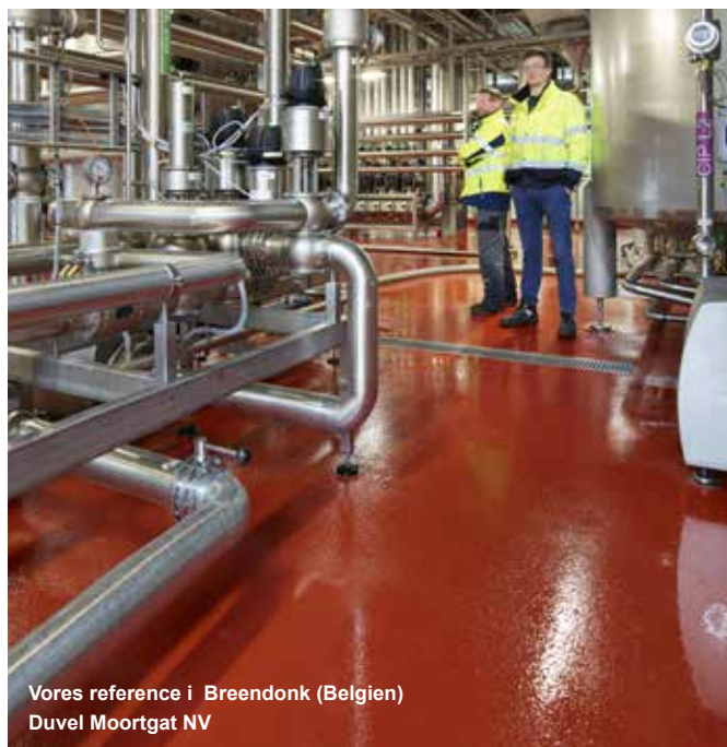
Vores reference i Breendonk (Belgien) Duvel Moortgat NV