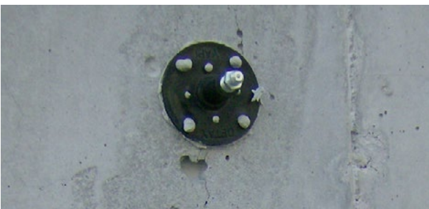
Obr 1. Umiestnenie injektážneho pakra lepeného na povrch trhliny

Umiestnenie injektážnych pakrov by sa malo určiť pred aplikáciou. V závislosti od rozmerov trhliny a stavebného prvku by sa mali injektážne paker umiestniť v rozstupoch 15 – 50 cm pozdĺž dĺžky trhliny. Na zafixovanie pakra do betónu naneste malé množstvo vhodnej epoxidovej malty/